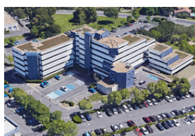
Décret tertiaire Site de Tencavel Montpellier Siège ENEDIS