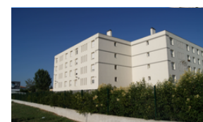
Réhabilitation Energétique de 45 logements Résidence Cité Char Isle sur la Sorgue