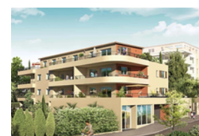
Rénovation Energétique Globale Les Aliziers à Manosque