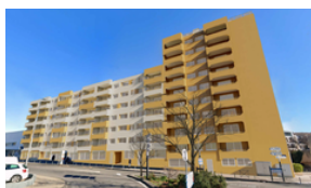
Rénovation énergétique globale Copropriété Le Voltaire Aubagne