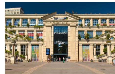
Réhabilitation CVC et CFo.CFa Galeries Lafayette Montpellier