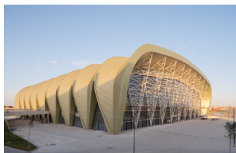
Construction d'une Piscine olympique couverte 1500 places assises Complexe Olympique Oran