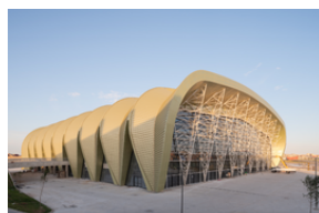
Construction du Complexe Olympique d'Oran Piscine olympique couverte 1500 places assises