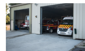
Construction du SDIS à Mimet CVC et CFo.CFa