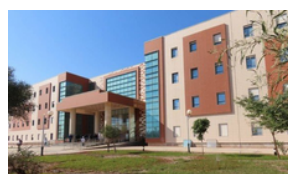
Construction Hôpital 240 lits Touggourt