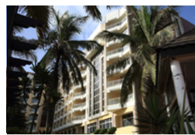
Construction Hôtel 5* King Fahd Palace à Dakar