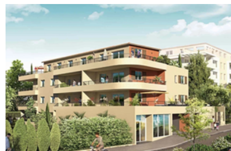
Rénovation Énergétique Globale Les Aliziers à Manosque