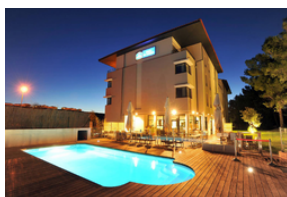
Extension Hotel Best Western Aix La Duranne

Ces références sont issues de nos nombreuses années d'expérience au sein de différentes entreprises