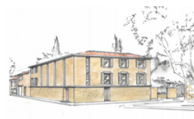
Construction de 10 logements sociaux Mas Thibert