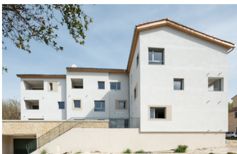
Construction de 10 logements Maison André à Coudoux

Notre engagement : concevoir des projets optimisés grâce à l'utilisation d'outils de simulation et d'analyses thermiques, afin de garantir un haut niveau de performance énergétique et une approche raisonnée en coût global.