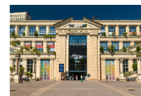
Réhabilitation CVC et CFo.CFa Galeries Lafayette Montpellier